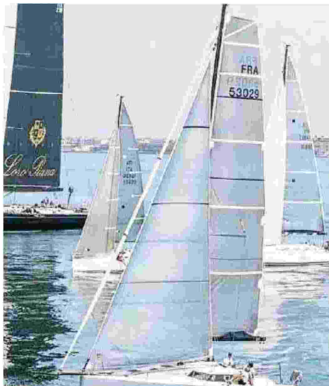
Una regata: in primo piano alcune imbarcazioni. Appuntamento sulla costa tra Rosignano e Castiglioncello

la de' Medici. Per entrambe le manifestazioni il Porto turistico di Rosignano Marina Cala de' Medici mette a disposizione ausili ed ormeggi e sponsorizzerà il crew party per gli equipaggi che si terrà domani sera sabato 27 aprile, sempre al porto. La Settimana Velica Internazionale, giunta alla sua III edizione, è l'erede della "Regata del centenario", svoltasi nel 1981, quando l'Accademia ha compiuto il suo primo secolo di vita. Il Trofeo Baia del Porticciolo 70° CNC è nato ormai sette anni fa per celebrare l'importanza delle Vele Latine nel Mar Tirreno; in particolare il raduno ricorda la presenza di queste antiche imbarca-